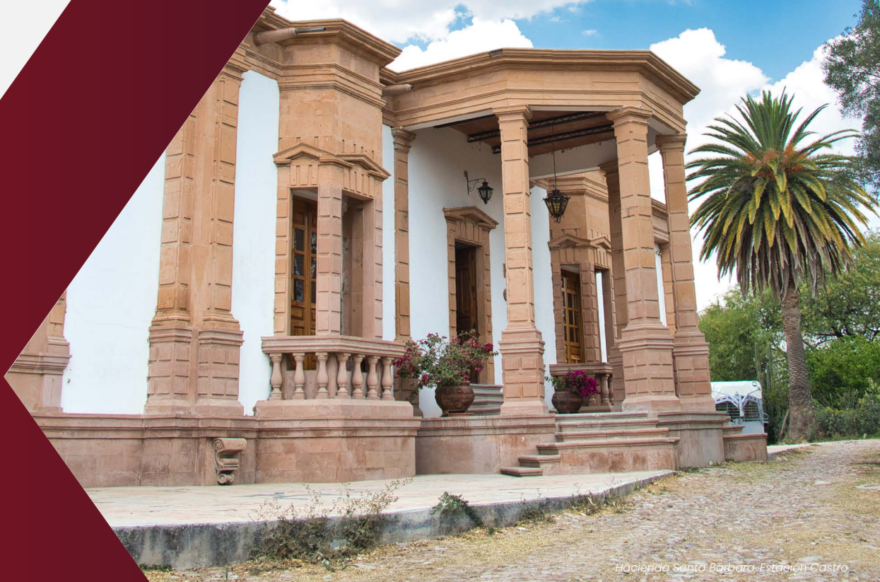
Hacienda Santa Bárbara - Estación Castro