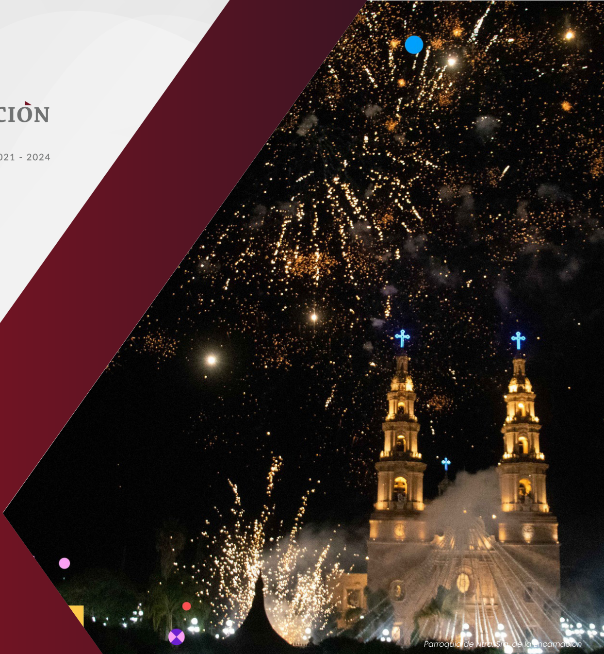
Parroquia de Ntra. Sra. de la Encarnación